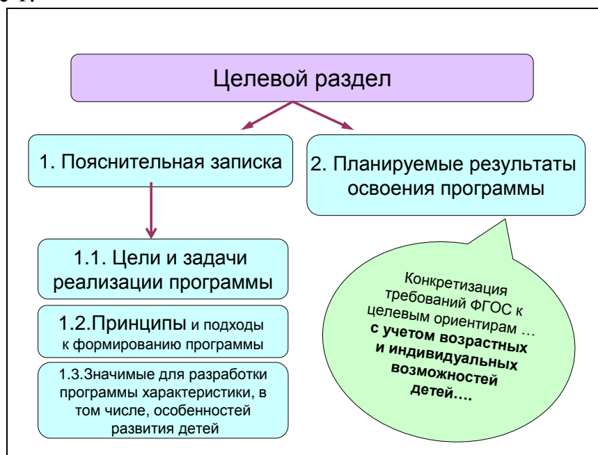
Схема 1. Структура целевого раздела Программы.

Проектирование основной образовательной программы начинается с Целевого раздела. Его структура в соответствии со Стандартом представлена на Схеме 1.